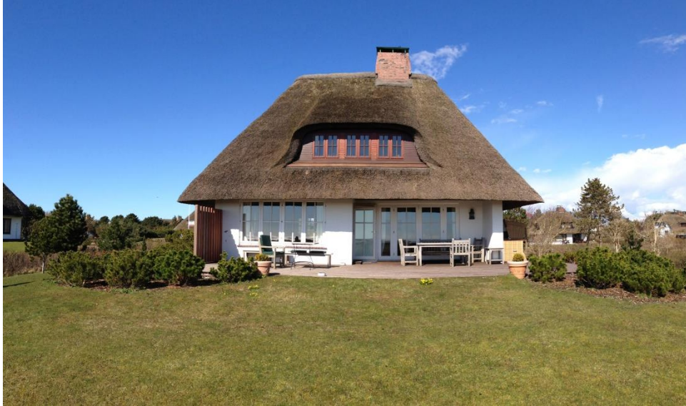
Nieblum, Greveling 24

Das Ferienhaus verteilt sich über EG, 1.OG und UG.